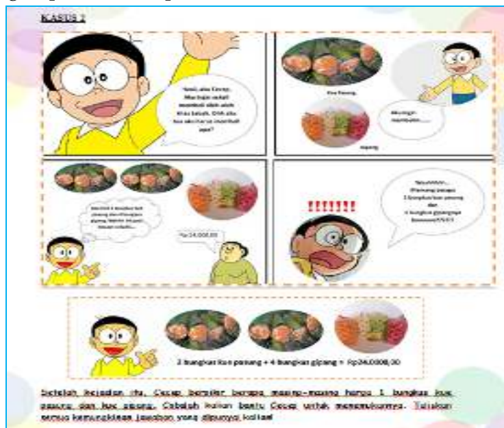
Gambar 2. Bahan Ajar Etnomatematika dengan Pendekatan Berbasis Masalah

Dari sisi pendekatan, bahan ajar dikembangkan dengan menggunakan pendekatan tak langsung berbasis masalah. Pemilihan ini berdasarkan hasil penelitian dari Febriani (2016) bahwa hasil belajar siswa pada materi SPLDV melalui pendekatan pembelajaran berbasis masalah lebih baik dibandingkan dengan menggunakan pendekatan langsung. Seperti terlihat pada contoh berikut.