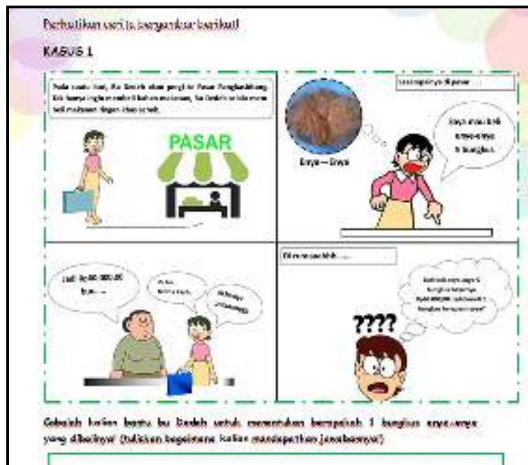
Gambar 1. Desain Bahan Ajar Berbasis Etnomatematika

Penggunaan ethno matematika pada pengembangan bahan ajar dipadukan dengan aktivitas komik. Melalui penyajian komik diharapkan dapat mendorong peningkatan motivasi dan ketertarikan siswa untuk membaca bahan ajar yang dikembangkan. Komik pembelajaran dalam teknologi pendidikan bersifat edukatif dan menciptakan unsur penyampaian pesan yang jelas serta komunikatif (Novianti & Syaichudin, 2010). Komik adalah suatu kartun yang mengungkapkan suatu karakter dan memerankan suatu cerita dalam urutan yang erat, dihubungkan dengan gambar dan dirancang untuk memberikan hiburan kepada pembaca (Rohani dalam Novianti & Syaichudin. 2010). Sedangkan hasil penelitian Maulana (Putri & Ariyanti, 2015) menyimpulkan bahwa penggunaan matematika komik merupakan hal yang kreatif, inovatif, menyenangkan, dan lebih diminati oleh siswa. Dengan demikian, penggunaan bahan ajar berbasis etnomatematika dengan seting komik disamping memberikan