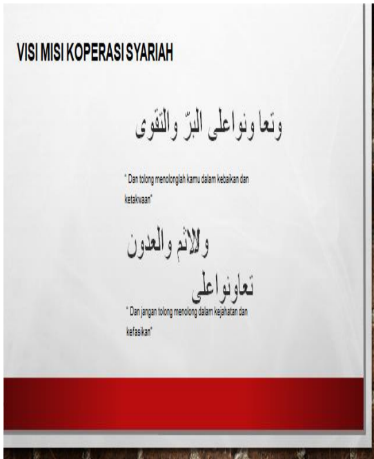
Gambar 5 Display Koprasi Syariah