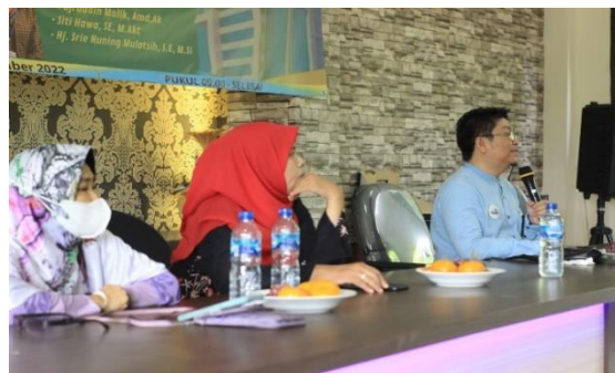
Gambar 1 Kegiatan Pemaparan Materi.

Setelah pemaparan materi selesai selanjutnya diadakan diskusi dan tanya jawab antara peserta sosialisasi dan narasumber, masyarakat bisa memberikan pendapat atau pertanyaan yang berhubungan dengan koperasi syariah ataupun hal ini diluar koperasi syariah.