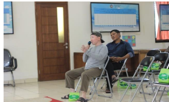
Gambar 7 Display Materi Kopsyah