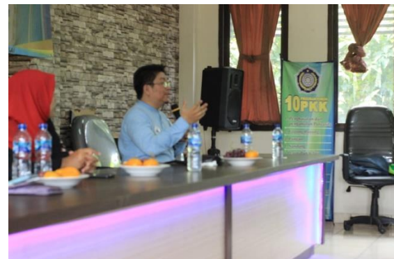
Gambar 8 Diskusi dan tanya jawab