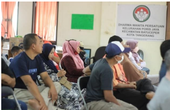
Gambar 2 Peserta Kegiatan PKM

Dalam diskusi dan tanya jawab dilihat sejauh mana peserta sosialisasi dapat memahami materi yang disajikan dan bagaimana minat peserta untuk membangun lingkungan RW.04 melalui koperasi syariah.