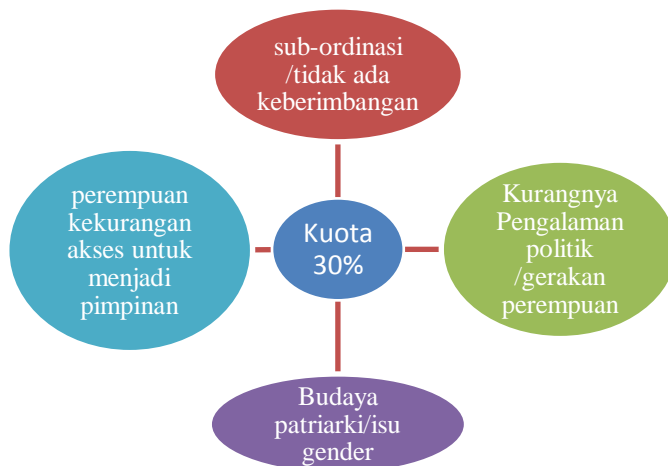
Gambar 5. Define Problems (pendefinisian masalah)

Define Problem (Definisi masalah) merupakan elemen pertama kali yang dapat kita lihat sebagai master frame (bingkai utama), yang akan menggambarkan bagaimana isu atau peristiwa dipahami secara keseluruhan. Seperti yang telah digambarkan di atas menekankan bahwa bagaimana seorang wartawan memahami sebuah isu atau peristiwa mengenai representasi citra politisi perempuan dalam parlemen pada pemberitaan pasca pemilu 2019, yakni perempuan di parlemen tidak mewakili suara perempuan karena tidak memiliki keberimbangan dengan politisi laki-laki yakni kuota yang tidak mencapai 30%. Hal tersebut dikarenakan; kurang adanya akses perempuan untuk menjadi pimpinan di parlemen, Kurangnya pengalaman politik atau gerakan perempuan dalam politik, tidak adanya keberimbangan antara perempuan dan laki-laki, sampai dengan isu gender yang