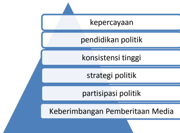
Gambar 8. Treatment Recommendation (membuat keputusan moral)

tahun 2019 yakni harus adanya keberimbangan antara pemimpin perempuan dan pemimpin laki-laki di Parlemen sehingga kebijakan yang responsif gender segera terwujud. Politisi perempuan harus mampu mengembalikan citra Parlemen di mata publik sehingga kepercayaan masyarakat terhadap kinerja perempuan dapat