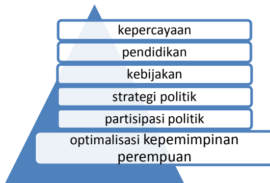
Gambar 4. Treatment Recommendation (membuat keputusan moral)

Pada elemen keempat yakni treatment recommendation (menekankan penyelesaian), yakni jalan untuk menyelesaikan masalah yang tergantung pada bagaimana sebuah peristiwa dilihat dan siapa yang dipandang sebagai masalah. Adapun rekomendasi terhadap pemberitaan perempuan dalam parlemen adalah sebagai berikut, harus adanya pengoptimalisasi kepemimpinan perempuan dengan memberikan kepercayaan kepada perempuan bahwa perempuan mampu menjadi seorang pemimpin. Mendorong perempuan ikut aktif dalam partisipasi politik, bukan hanya sebagai penonton bagi kaum laki-laki dalam mengambil kebijakan. Partai politik maupun pemerintahan harus memiliki strategi agar perempuan dapat terpilih berdasarkan kompetisinya bukan hanya populernya saja. Keterwakilan perempuan dalam parlemen tentu akan menghasilkan sebuah kebijakan yang pro terhadap perempuan. Keterwakilan perempuan dalam politik akan maksimal apabila