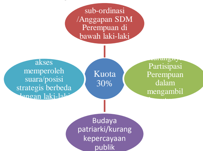
Gambar 1 Define Problems (pendefinisian masalah) Voaindonesia.com

Melalui analisis Framing (Eryanto, 2002:24) yakni pendekatan untuk mengetahui