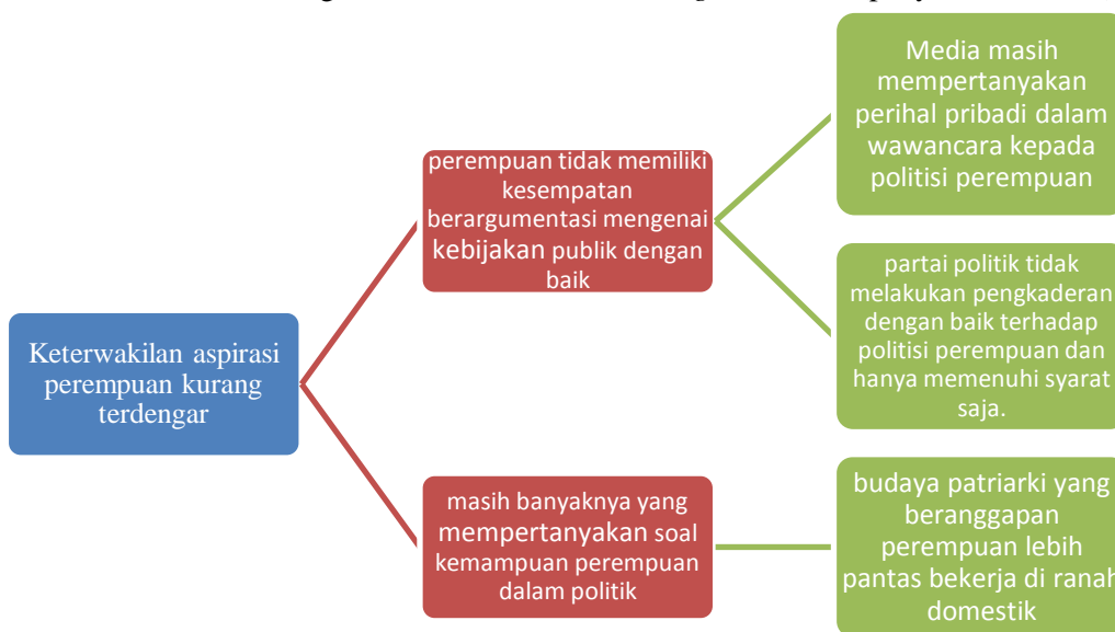
Gambar 2 Diagnose cause (penyebab masalah) Voaindonesia.com

Diagnose causes merupakan elemen framing untuk mbingkai penyebab masalah yang muncul terkait apa (what) atau siapa (who) dalam pemberitaan yang dibuat oleh media Voaindonesia.com terkait politisi di Parlemen. Permasalahan yang muncul yakni keterwakilan aspirasi perempuan kurang terdengar sehingga tidak dapat menyampaikan dan membuat kebijakan yang perspektif gender dengan baik. perempuan tidak memiliki kesempatan berargumentasi mengenai kebijakan publik dengan baik, dikarenakan beberapa faktor, yakni ; Media masih mempertanyakan perihal pribadi dalam