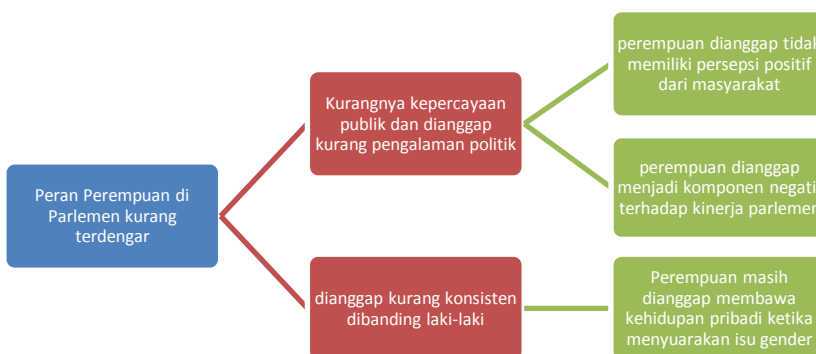
Gambar 6. Diagnose cause (penyebab masalah)