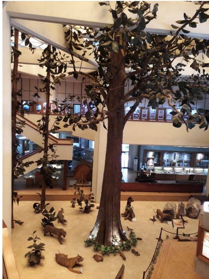
Gambar 2. Interior Museum Kehutanan

Kak Eki yang berprofesi sebagai Pemandu sekaligus Edukator Museum Kehutanan memaparkan bahwa pengunjung yang datang ke Museum Kehutanan umumnya adalah pelajar, mahasiswa, peneliti serta para profesional di bidang kehutanan. Namun yang menjadi rombongan terbanyak adalah pelajar sekolah terutama di tingkat SD dan SMP. Umumnya pelajar ini berkunjung secara rombongan yang diatur oleh sekolahnya dalam bentuk kegiatan study tour . Dalam kaitannya dengan layanan virtual tour , Kak Eki, menyebutkan bahwa layanan virtual tour tetap diadakan meski pandemi telah berakhir. Menurutnya ada beberapa sekolah dari luar kota yang ingin berkunjung dalam jumlah besar namun terkendala waktu dan transportasi serta akomodasi, sehingga mereka memilih menggunakan layanan ini, apalagi layanan ini gratis dan difasilitasi oleh Pusdatin KLHK.