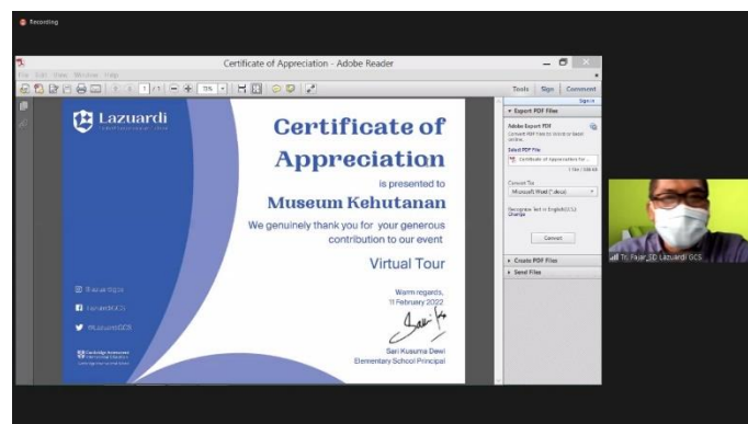
Gambar 5. Apresiasi Pihak Sekolah sebagai Peserta Virtual Tour di Museum Kehutanan

Peneliti melakukan pengamatan pada kesan dan pesan yang disampaikan peserta virtual tour pada tautan googleform yang dibagikan pada kolom chat zoom oleh Panitia dari Museum kehutanan. Respon peserta umumnya positif dan beberapa diantaranya tertarik untuk datang berkunjung secara langsung ke Museum Kehutanan. Peserta yang terdiri atas pelajar dan guru serta kepala sekolah secara langsung di media zoom menyampaikan apresiasi dalam prosesi penyampaian sertifikat penghargaan yang ditampilkan pada layar monitor zoom .