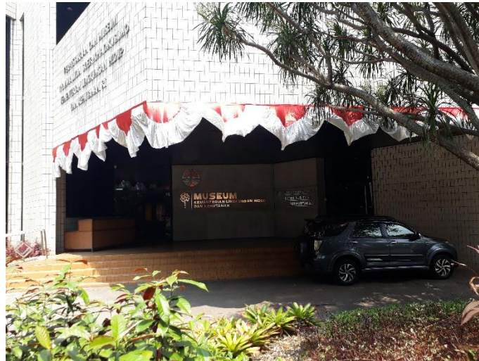
Gambar 1. Tampak Depan Museum Kehutanan

Museum Kehutanan yang berada di Komplek Manggala Wanabakti mempunyai luas bangunan sekitar 1.466 m 2 , yang terdiri atas dua lantai. Lantai pertama berisi pameran tetap artefak kehutanan, dan pada lantai kedua berisi pameran tetap dokumentasi foto kegiatan di bidang kehutanan serta perpustakaan sebagai fasilitas museum. Museum ini dapat diakses secara gratis oleh publik. Selain itu Museum ini juga mempunyai dua kegiatan utama yakni program publik dan program edukasi. Program publik antara lain berupa kegiatan-kegiatan untuk publik seperti pameran temporer dan pameran keliling, serta kegiatan seminar atau webinar yang membahas seputar isu-isu di bidang permuseuman maupun lingkungan hidup dan kehutanan, menurut Kak Eki.