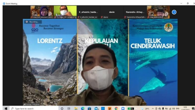
Gambar 3. Sambutan Pimpinan Museum Kehutanan pada Virtual Tour

Pihak Museum Kehutanan telah menyiapkan rangkaian acara pada kegiatan virtual tour . Dimulai dengan registrasi peserta dengan memberi nama akun ID zoom sesuai nama pribadi peserta dan kelas sekolahnya. Selanjutnya pembawa acara (MC) akan membacakan susunan acara dan tata tertib peserta virtual tour . Doa bersama mengawali rangkaian kegiatan yang dilanjutkan dengan prosesi menyanyikan lagu kebangsaan Indonesia Raya. Sambutan dari kedua belah pihak disampaikan, dimana mewakili Museum Kehutanan adalah Kepala Bidang Pengelolaan Data dan Informasi (PDI), yakni Bapak Firman Maulana. Selanjutnya adalah sambutan dari perwakilan tamu rombongan, biasanya Kepala Sekolah atau Wali Kelas, menurut Kak Eki.