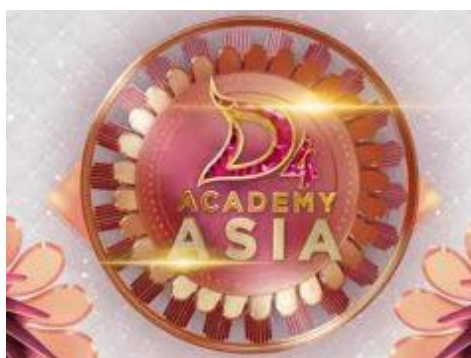
Gambar 1 : Logo D Academy Asia 4

Acara ini ditayangkan pada tanggal 16 November 2015 (musim pertama), 23 Oktober 2016 (musim kedua), 23 Oktober 2017 (musim ketiga) dan 21 Oktober 2018 (musim keempat). Seluruh peserta yang telah lolos seleksi audisi dari negara masing-masing di babak audisi dikirim ke Indonesia untuk diberikan pelatihan-pelatihan berupa koreografi, olah vokal, performance, training kepribadian, dan tata busana oleh para ahli di bidangnya masing-masing. Contoh guru yang terlibat yaitu Adibal Sahrul untuk pelatih vokal (sejak musim pertama) dan Erie Suzan (mulai musim kedua). Seluruh peserta yang telah lolos terseleksi setiap minggunya akan diadu dalam babak-babak yang telah ditentukan, hingga tersisa 3 peserta yang akan berkompetisi untuk memperebutkan gelar juara pertama di malam grand final (Division Production IEP, 2019).