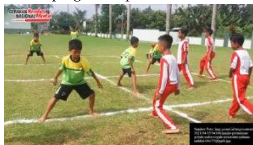
Gambar 11 Permainan Gobak Sodor